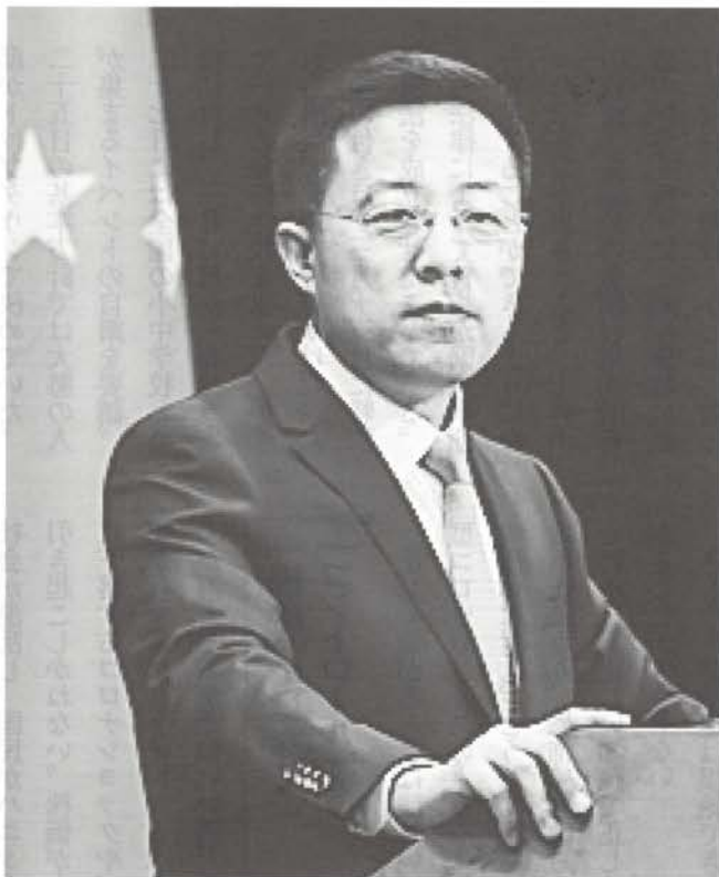
「この感染症は米軍が武漢に持ち込んだものかもしれない」