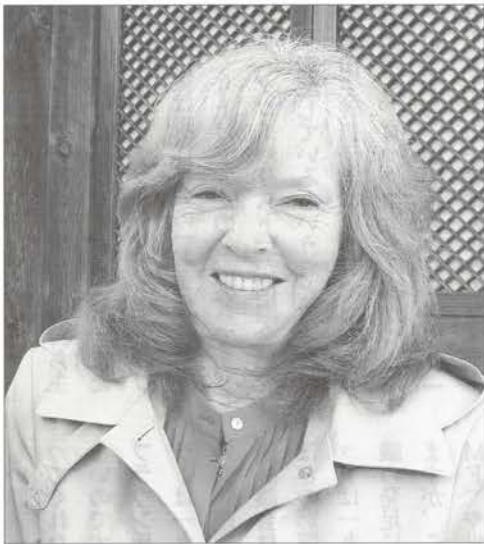
Ellen Brown 米国ロサンゼルス出身の作家、司法弁護士、社会活動家。公共銀行制度研究所の創始者であり会長 ( http://www.publicbankinginstitute.org/ )。「THE WEB OF DEBT」(『負債の網』那須里山舎刊)は米国でベストセラーとなり、「Public Bank Solution」(本邦未訳)では、公共銀行の必要性を説いている。最新刊は「Banking on the People」(本邦未訳)で、2019年6月1日に米国で出版された。ブログはEllenBrown.comで読むことができる。民主的な経済を研究する「The Democracy Collaborative」のフェローでもある。

ブラウン氏 アメリカ陸軍フォート・デトリック基地の中にある生物兵器研究所ですね。昨年八月五日に閉鎖されて います。廃水の管理が不十分なた